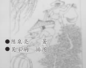
●陈泉亮 著 ●吴家驹 插图