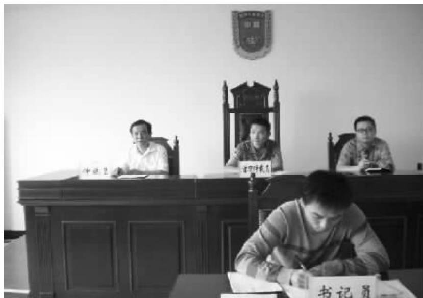
为提高劳动人事争议调解仲裁工作标准化建设水平,全力提升仲裁办案效率和质量,切实维护广大劳动者的合法权益,沂河区于2011年5月率先在全市范围内启动劳动人事争议仲裁院建设,该院已于今年8月完成基础性设施建设并投入使用。图为该院首次开庭现场。