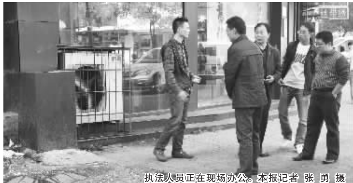
执法人员正在现场办公。