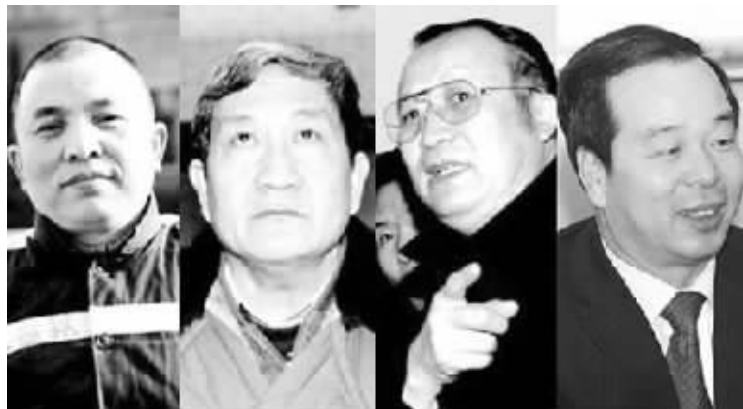
图从左至右:曾锦城、张昆桐、石发亮、董永安

10 月 9 日,河南省交通运输厅原厅长董永安涉嫌受贿罪案一审在许昌市中级人民法院开庭审理。16 年来,河南省交通厅已有 4 名交通厅长相继“落马”。