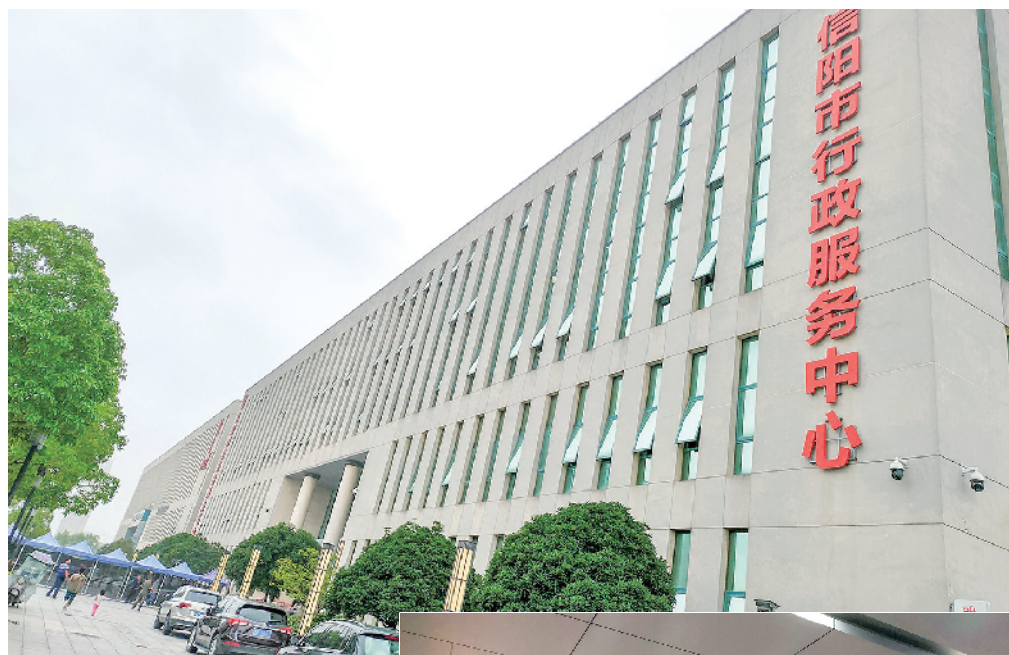
大图:市行政服务中心外景