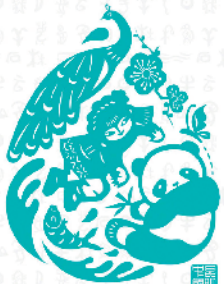
2020 UN BIODIVERSITY CONFERENCE COP15 - CP/MOP10 - NP/MOP4 Ecological Civilization Building a Shared Future for All Life on Earth KUNMING, CHINA

新华社北京1月9日电(记者高敬)9日,2020年联合国生物多样性大会(COP15)会标正式在京发布。