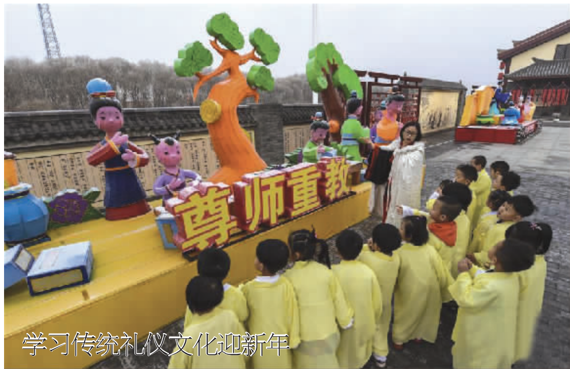
学习传统礼仪文化迎新年

12月27日,孙敬学堂的老师在给孩子们讲解尊师重教的历史故事。新年临近,河北省衡水市的孙敬学堂举办“学传统文化过快乐新年”少儿活动,通过国学经典诵读、培训传统礼仪等,让少年儿童亲身感受中国传统礼仪文化的魅力。